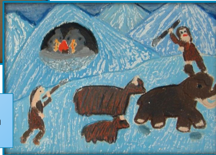
Praca konkursowa Zuzi.